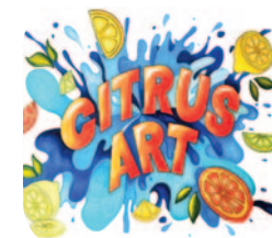
Illustrazione di Alyssa Brizio (11 classificata 2019)

I visitatori saranno invitati ad esprimere la propria preferenza, che darà luogo ad un premio di "giuria popolare", oltre a quelli stabiliti dalla giuria di esperti.